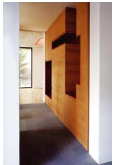
Skulpturaler Raum statt platter Fläche: Labyrinthartige Nischen der Garderobe sind farblich abgesetzt