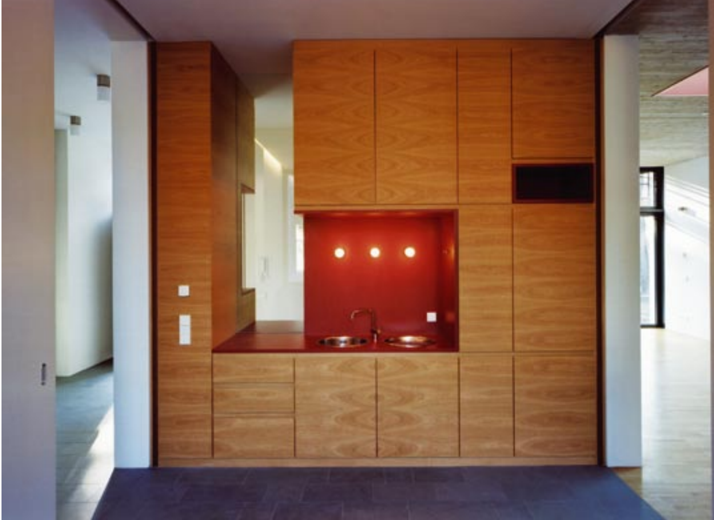
Diese Küchenfront ist ein souveränes Beispiel für moderne Gestaltungsmöglichkeiten mit Furnier (Eiche horizontal)